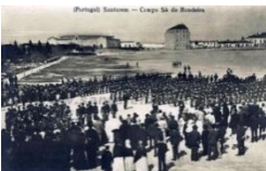
Campo Sã da Bandeira

Horário: Seg. a Sex. das 09h00 às 12h30 e das 14h00 às 17h30